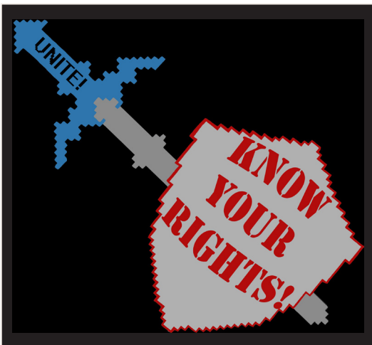
Illustration par Sarah G.

Beaucoup d'employeurs violent les droits de leurs travailleur·ses·rs en toute impunité parce que ces travailleur·ses·rs ne sont pas syndiqué·e·s et n'ont aucun moyen de se défendre. La syndicalisation est la meilleure manière de nous assurer que nos droits soient respectés. Si vous soupçonnez que vos droits sont bafoués, ou êtes curieu·se·x sur les prochaines étapes à suivre, Game Workers Unite et S'ATTAQ sont là pour vous aider - n'hésitez pas à nous contacter!